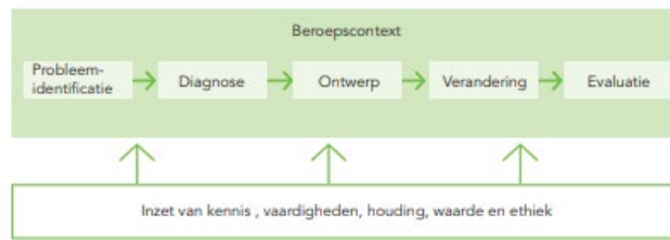
figuur 1:bedrijfskundige handelingscyclus (LOOBK, 2018)

elkaar heen gaat. Evaluaties vinden niet alleen meer op het einde plaats, maar ook als startpunt of als tussentijdse activiteit om bijstellingen sneller mogelijk te maken.